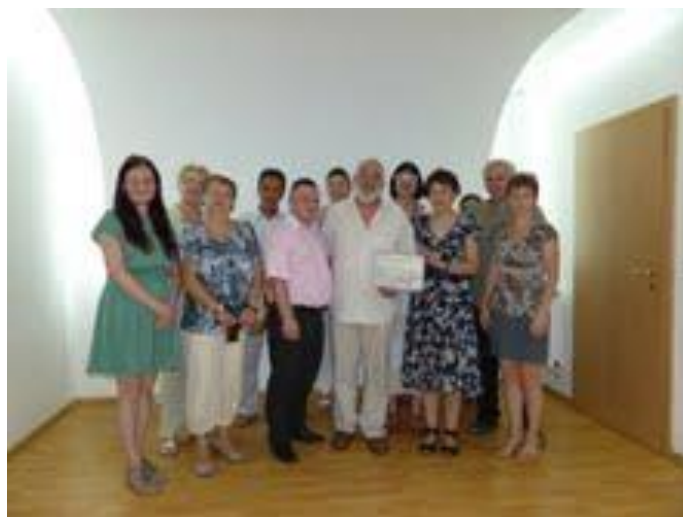
Poza grup – Asociatia APZR si reprezentanti RUR Biroul Teritorial al Regiunii de Dezvoltare Vest