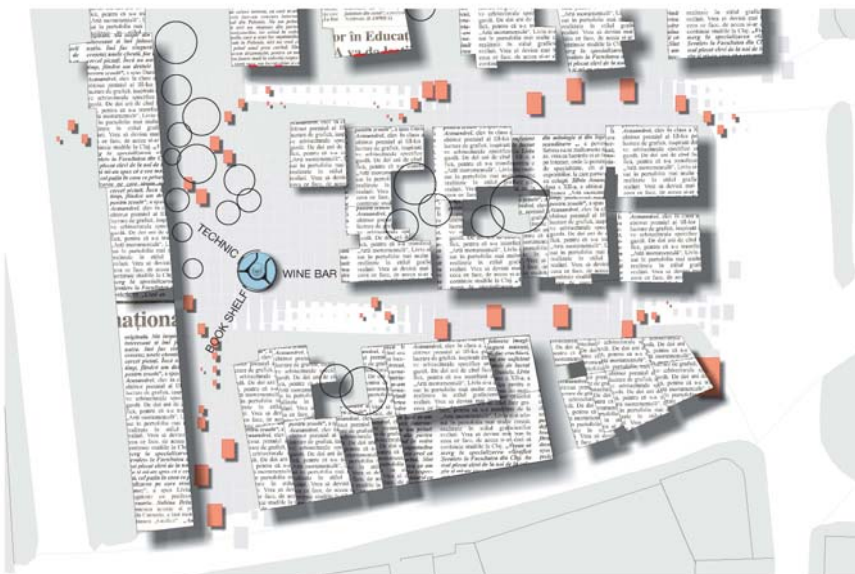
PAVILION CE SE TRANSFORMA IN RELATIE CU EVENIMENTELE SPECIFICE DE LA NIVELUL ORASULUI / 1:500