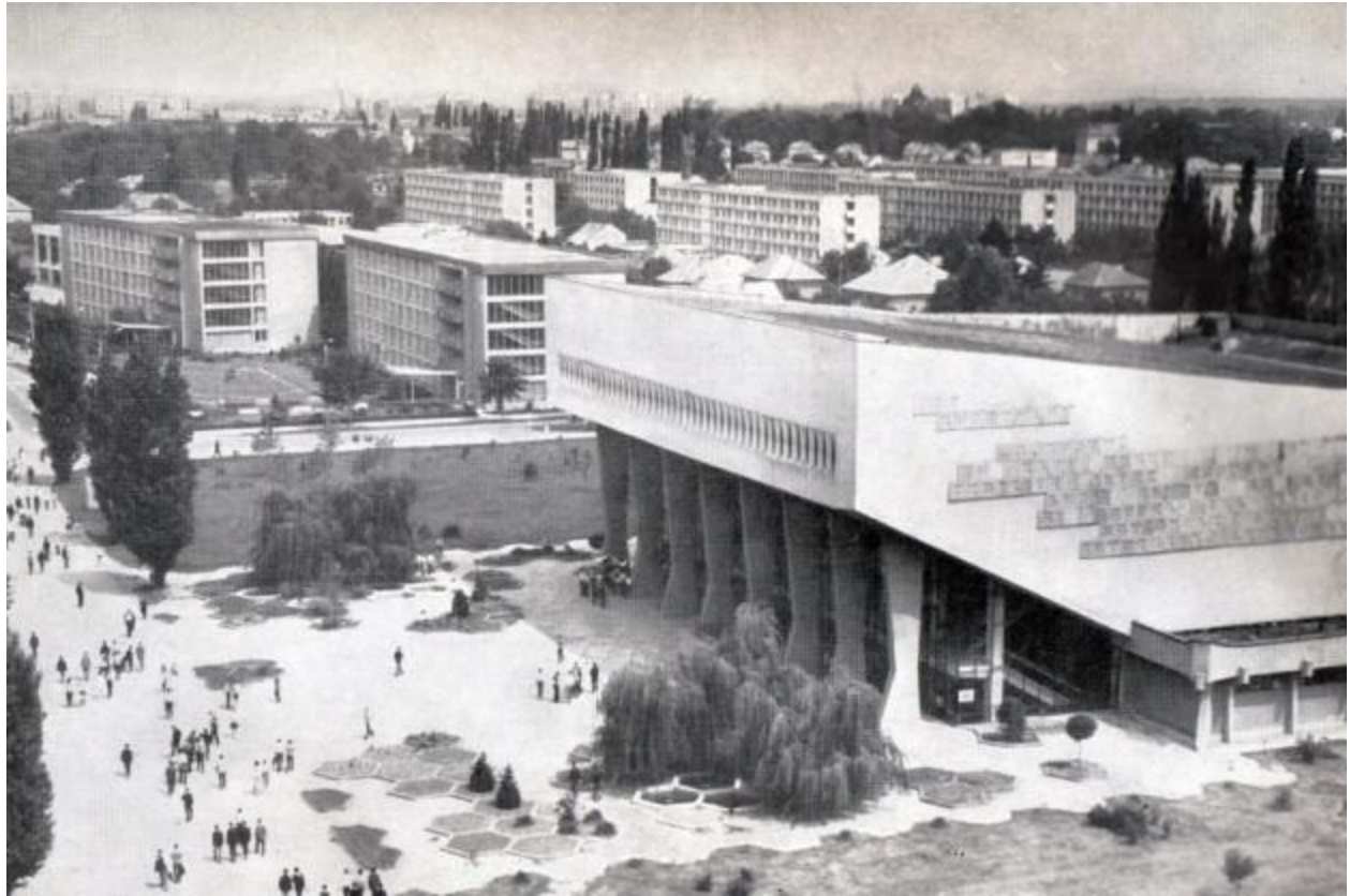
fig. 5- Sala Sport Olimpia, Timișoara;

Grumeza Radu – clădire UPT, Bdul Republicii Timișoara, (1964/5);