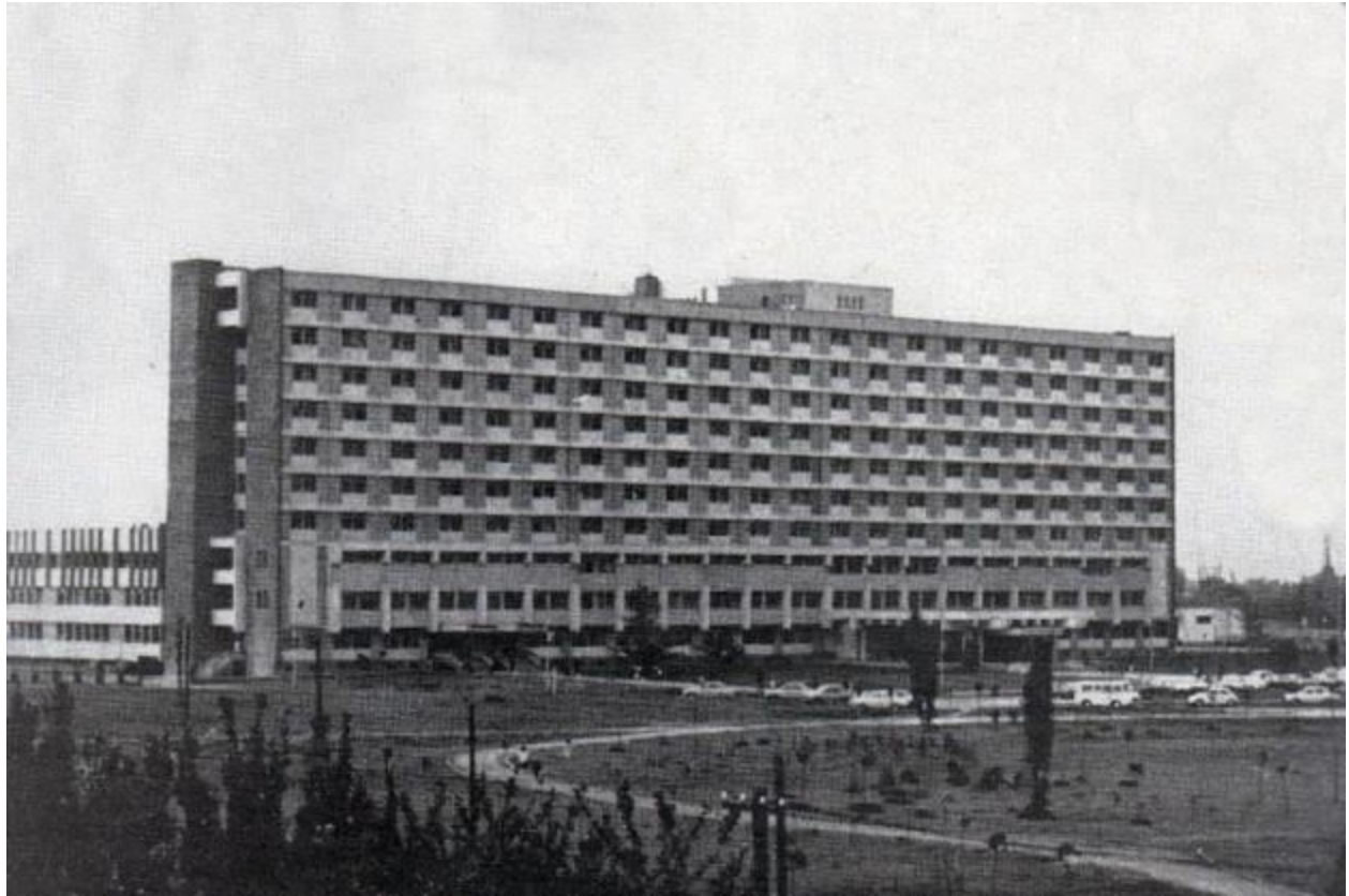
fig. 9 – Spitalul Județean, Timișoara

Mocănel (Voia) Geta – Esplanada spre Gara (cca 1965), Timișoara;