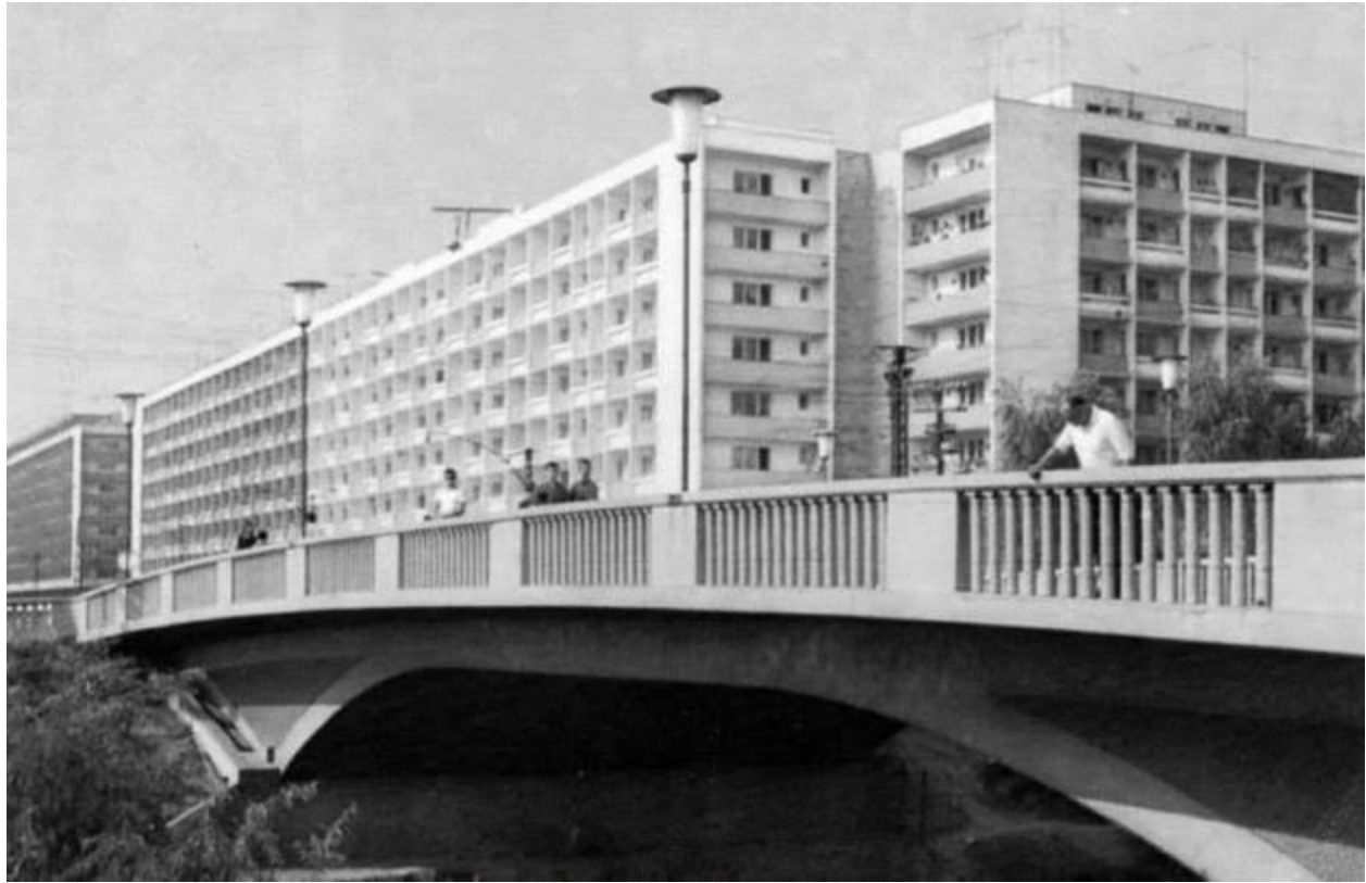
fig. 10 -str Gării , blocuri locuințe

Iojiță Ștefan – Ansamblul Peisagistic Flora cu Pavilionul Flora, malul Canalului Bega (început 1967), Timișoara;