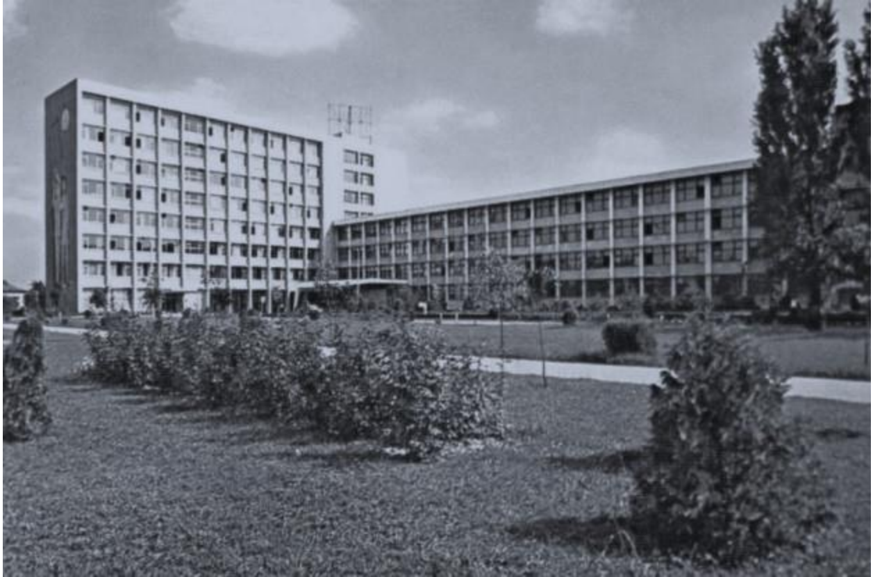
fig.4- Universitatea de Vest Timișoara;

-Liceul de Muzică str. Cluj (1967/68), Timișoara (colaboratori A. Fackelman);