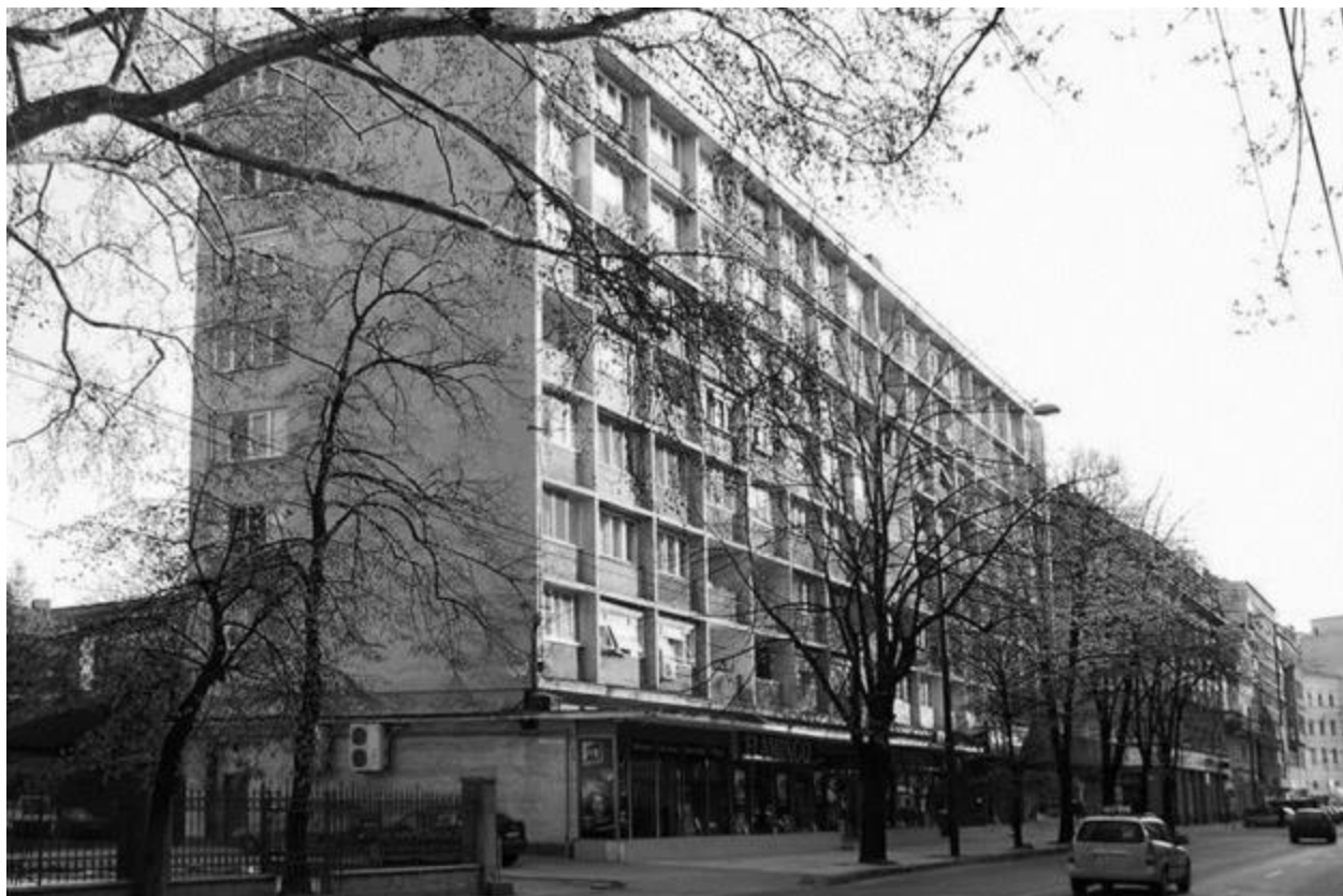
fig. 8- Bloc Locuințe Bdul Republicii, Timișoara

-Institutul Agronomic, Calea Aradului (1970/84), Timișoara;