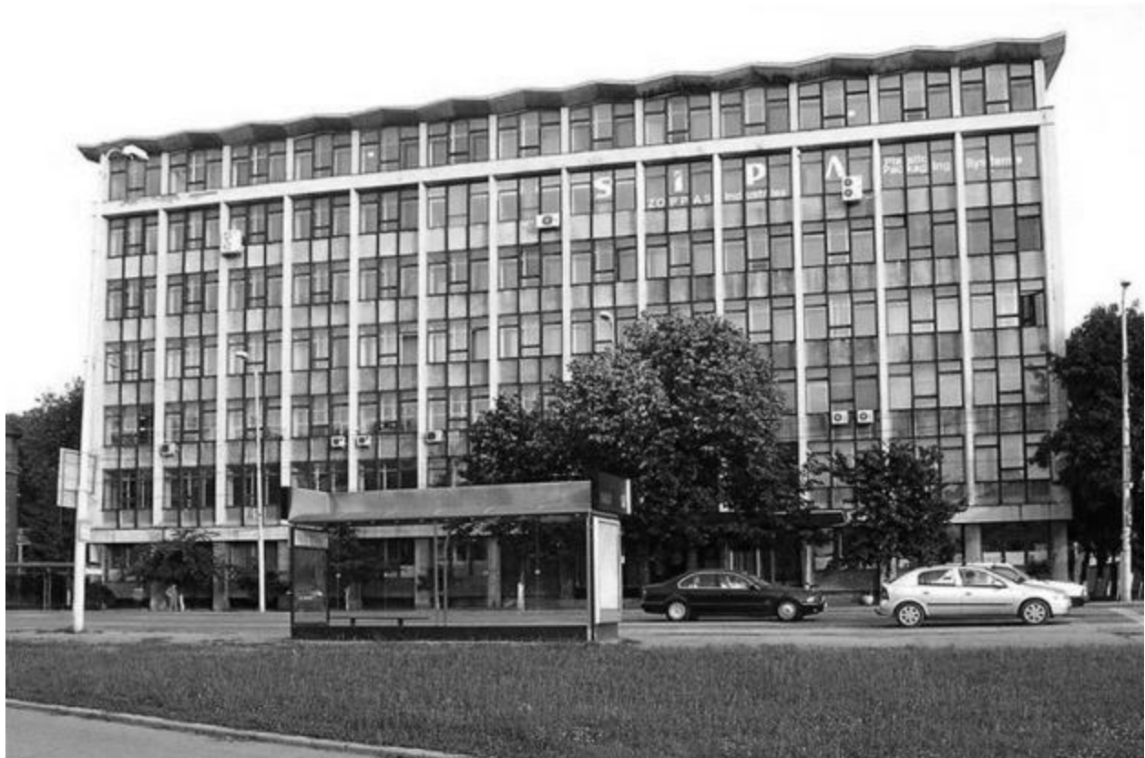
fig. 6 – Sediul UPT Timișoara