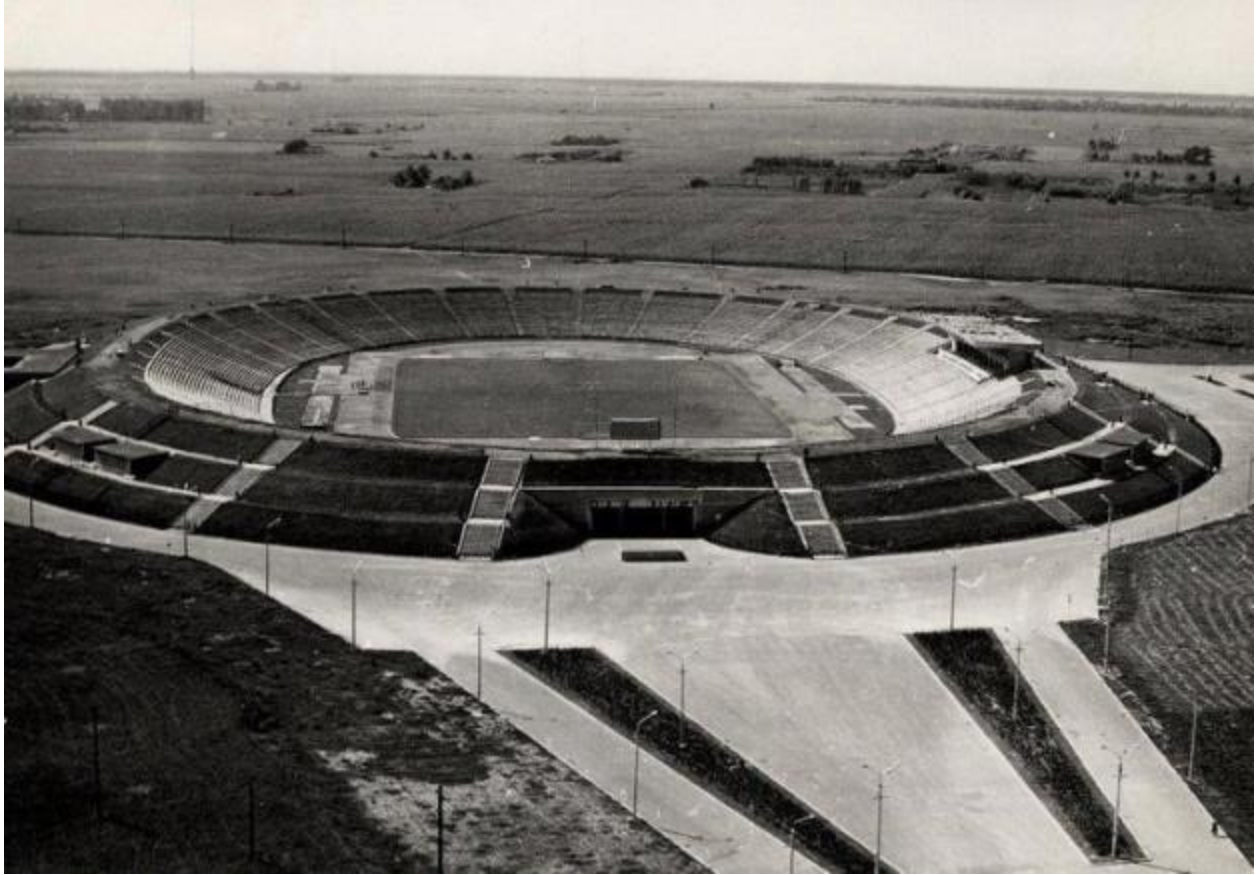
fig.7 –Stadionul 1 Mai, Timișoara