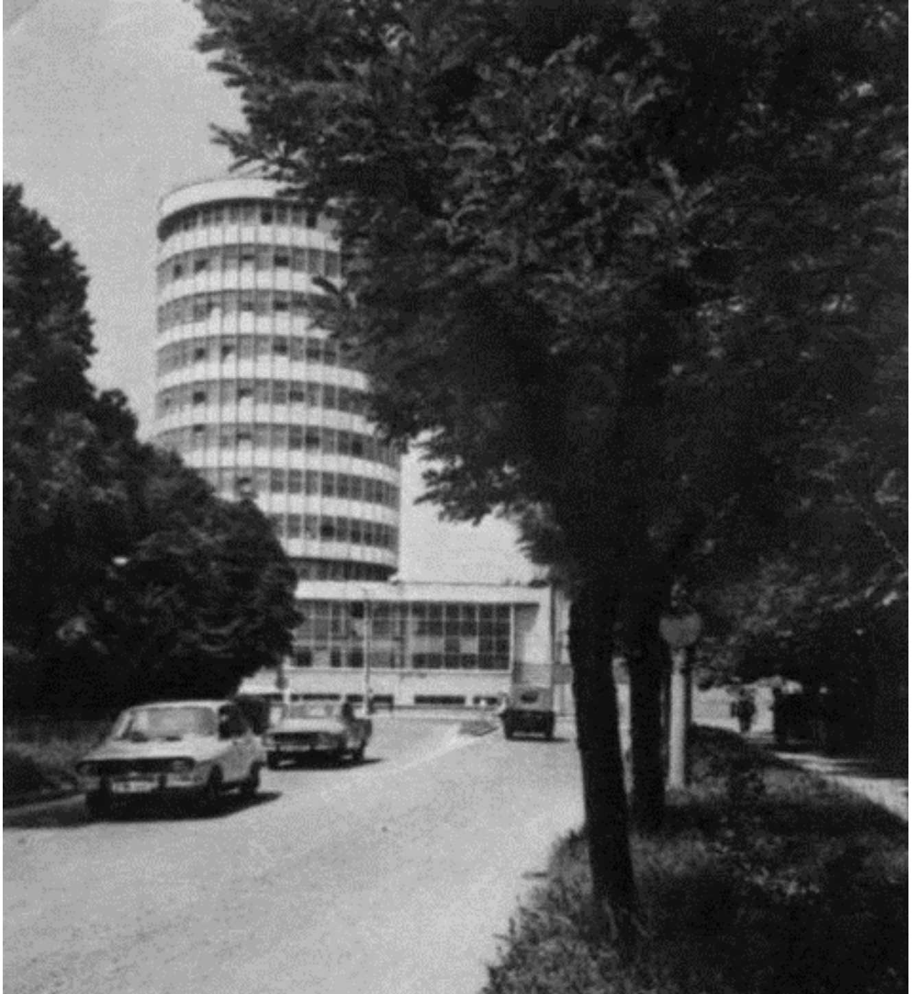
fig. 12- Sediu ISIM, bdul Mihai Viteazu, Timișoara