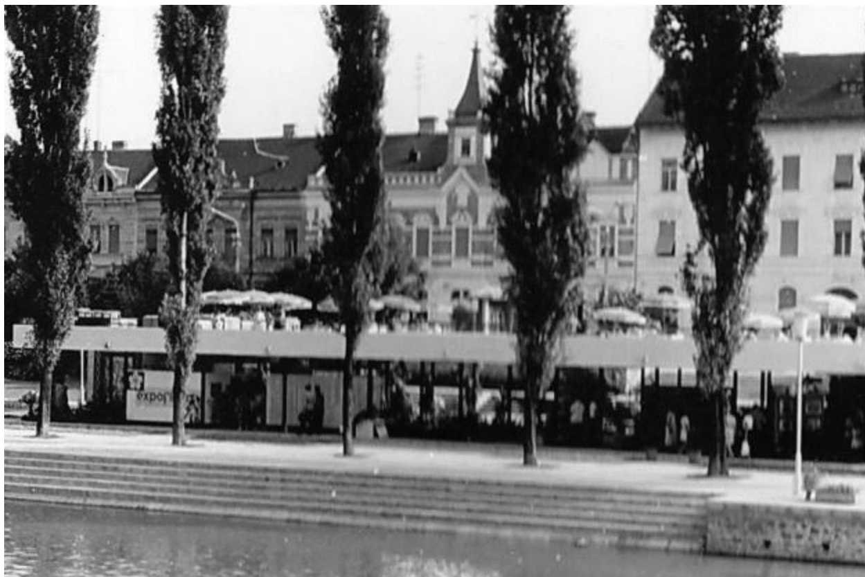
fig. 11- Terasa Flora –faza inițială doar cu stâlpi și placă

-Ansamblul Bastion cu Fântâna Punctelor Cardinale (1969), Timișoara;