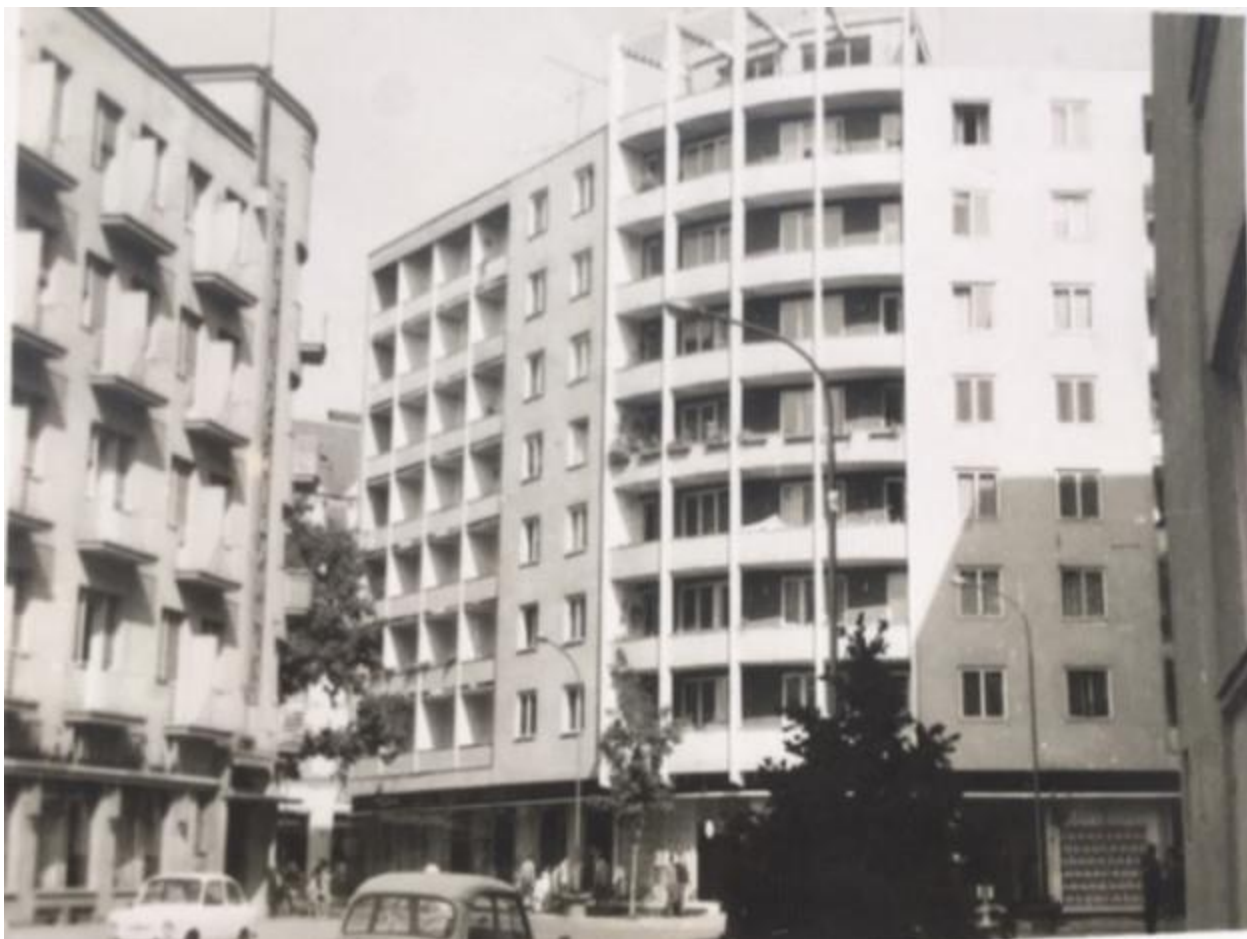
fig. 13- Bloc Locuințe str Piatra Craiului, Timișoara