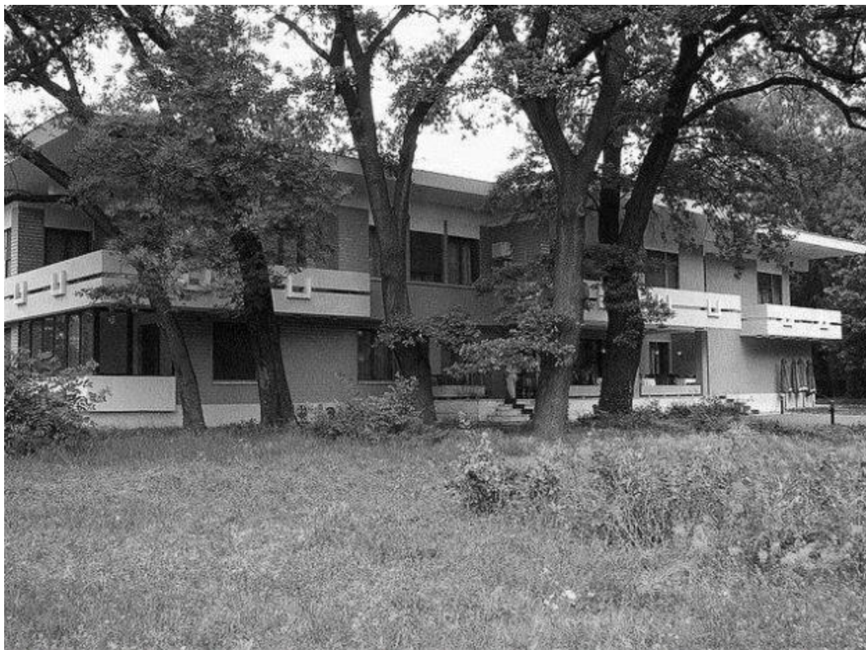
fig. 15- Casa de Oaspeți (vila de protocol N. Ceaușescu), Timișoara